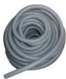
Căptușeală de chit Ø 10 mm